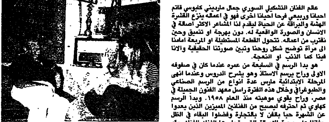
في حوار مع زينب حمود : التجربة